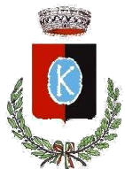
Comune di Casacalenda