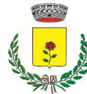
Comune di Ripabottoni